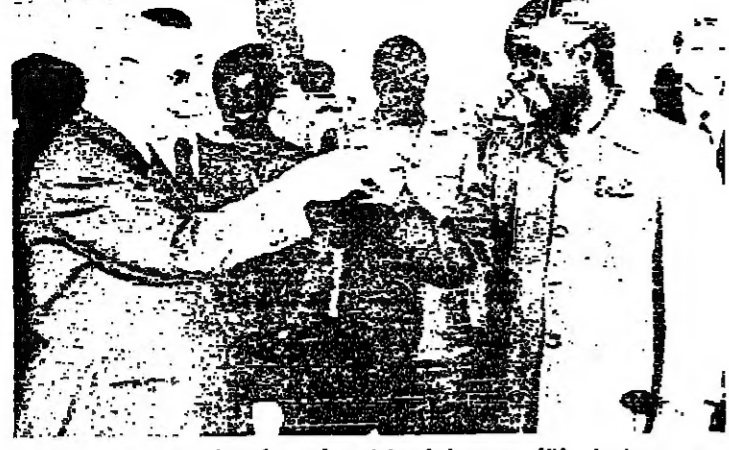
بوغدورفي أثناء وجوده في لوساكام رئيس زامبيا تيبري (صورة بالأعلى من اليمين)